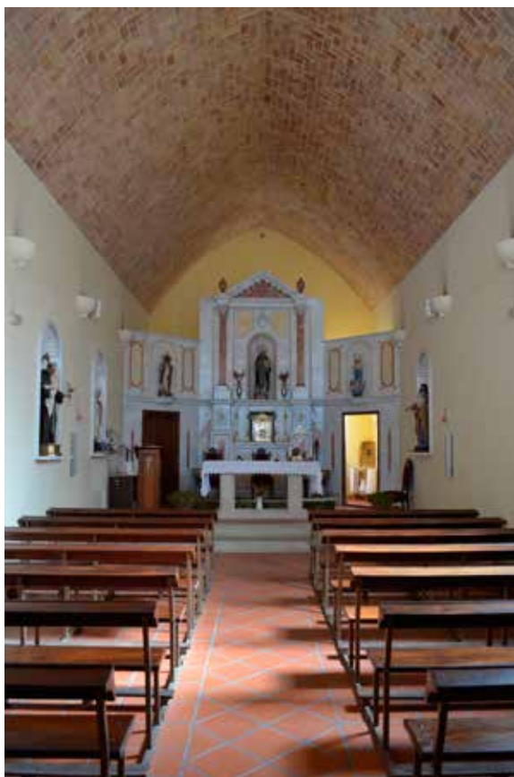
Iglesia parroquial de Casas de Moya