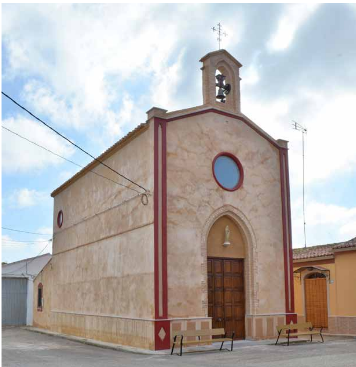
Iglesia parroquial Casas del Rey

neogótico y unas molduras de corte clásico en los arcos que comunican la nave central y las capillas laterales. ¿Cómo eran estas molduras y qué orden pautaba el alzado interior de la iglesia? ¿Cómo era el retablo original o, al menos, el neogótico? No parecen concordar con los de la moderna restauración, pero al menos sabemos que antes de la guerra tuvo la iglesia una decoración de tipo arquitectónica ahora perdida. Queda aquí planteada