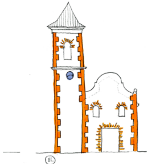
"Hipótesis de la evolución de la fachada de la iglesia de Casas de Moya"