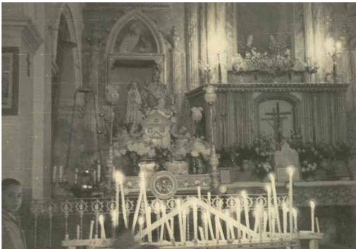
Iglesia antigua con Virgen de Loreto

el templo es de tres naves, con la nave central dividida en cuatro tramos y sus correspondientes capillas laterales, conectadas con la nave por arcos de medio punto y entre ellas por arcos escarzanos. Tiene unos arcos fajones cuyo intradós acusa la forma de las dos vertientes de la cubierta, a modo de arcos diafragma. Tiene un nártex bajo el coro y una potente torre en el lado del evangelio. De su actual decoración, totalmente moderna, poco podemos decir salvo una breve descripción. Las fotografías de antes de la intervención muestran cómo buena parte de ella es añadida: las vertientes de la cubierta definidas por los intradoses de los arcos se adornan con nervios de recuerdo ojival y acabado de imitación marmórea; en alzado, un orden de cornisa quebrada típicamente barroco, que imita mármoles, se apoya sobre capiteles corintios