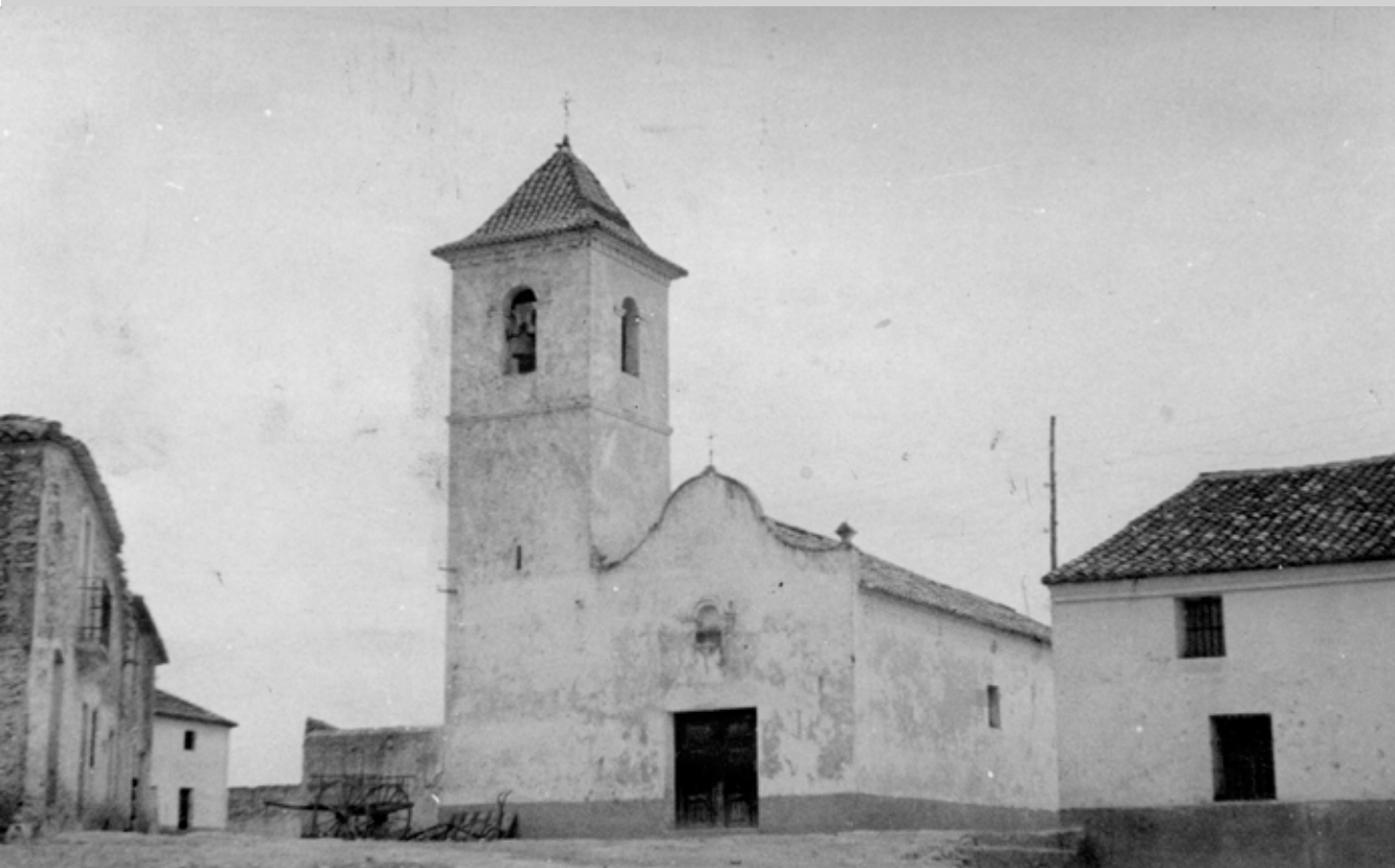
Iglesia de Casas de Moya

© José Pardo Conejero y Andrés Esteban Sánchez Torres