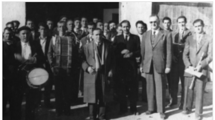
Acto de la banda en 1941'